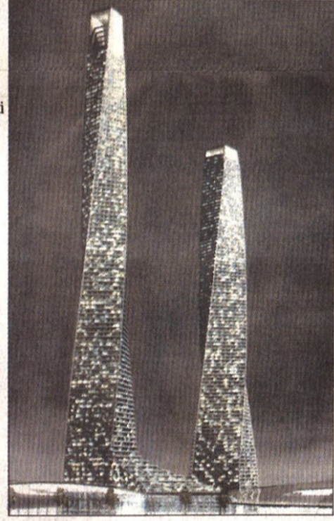
İstanbul'a bu kuleler yakışacak mı?