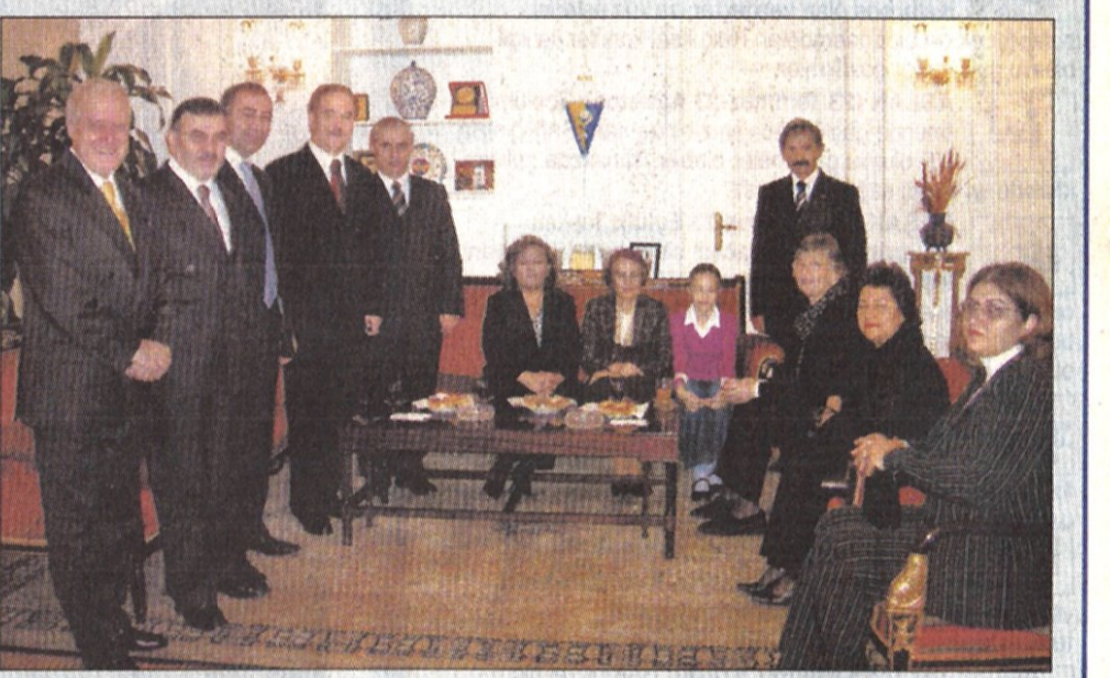
İlçede resmi bayramlaşma, Kadıköy İskele Başkanlık binasında yapıldı.