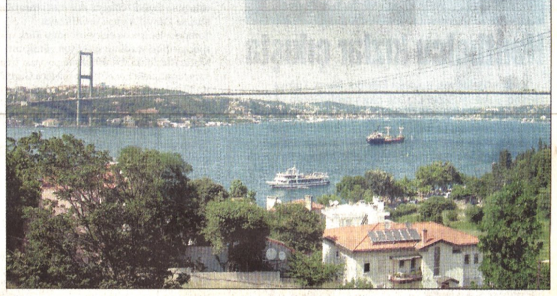
Boğaz'daki iki köprü yetmiyor diye şimdi de 3. köprü yapılmaya çalışılıyor...

İstanbul'da-kimilerinin "görgüsüzlük abidesi" dediği Dubai Towers'ın temelini 2006'da atılacağı söyleniyor. Levent civarındaki emlakçılar da, "Kurt dumanlı havayı sever" atasözünü gerçeğe dönüştürüyor. Bu bölgedeki