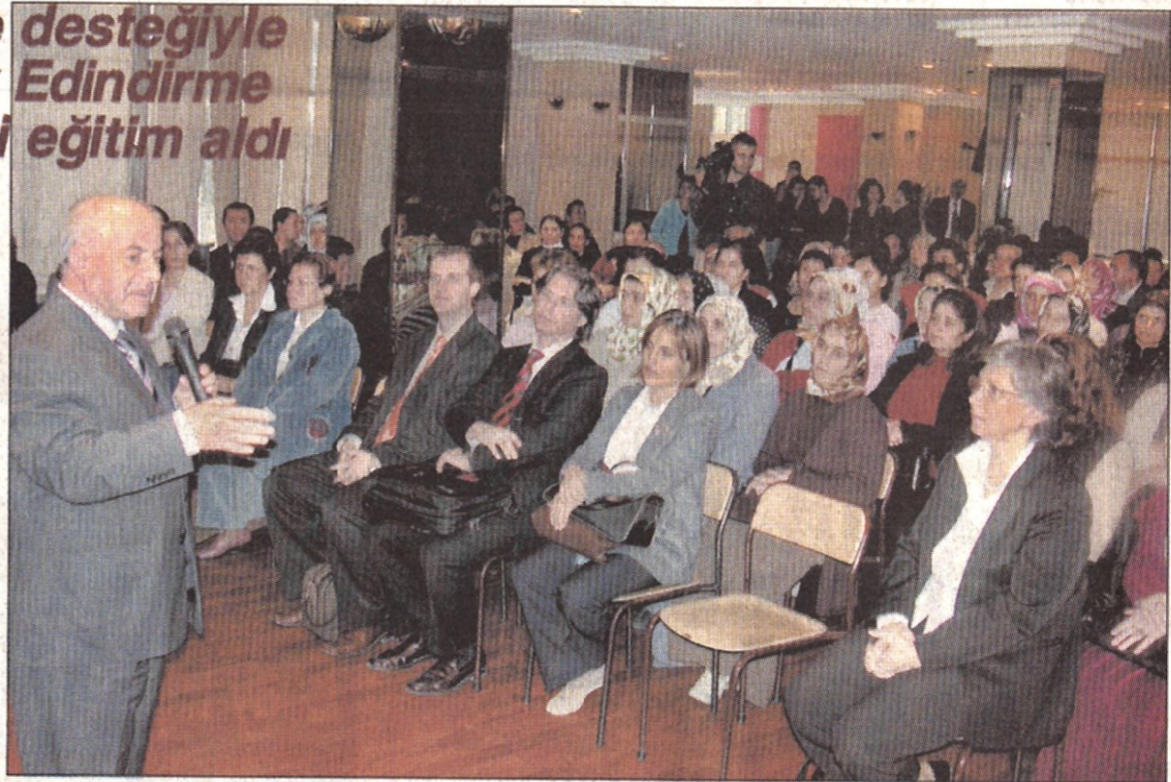
Başkan Öztürk, istihdam sağlama konusunda önemli çalışmalar yaptıklarını söyledi.